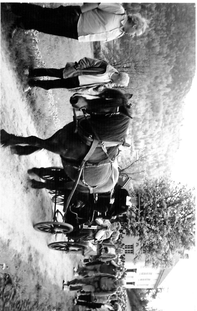
Her er følget på vei ut fra Vestre Øren med herskapet først.