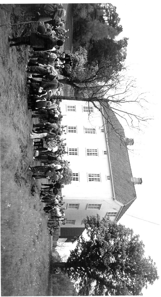
Det fredede huset på Vestre Øren dammet en ypperlig ramme for orienteringa.