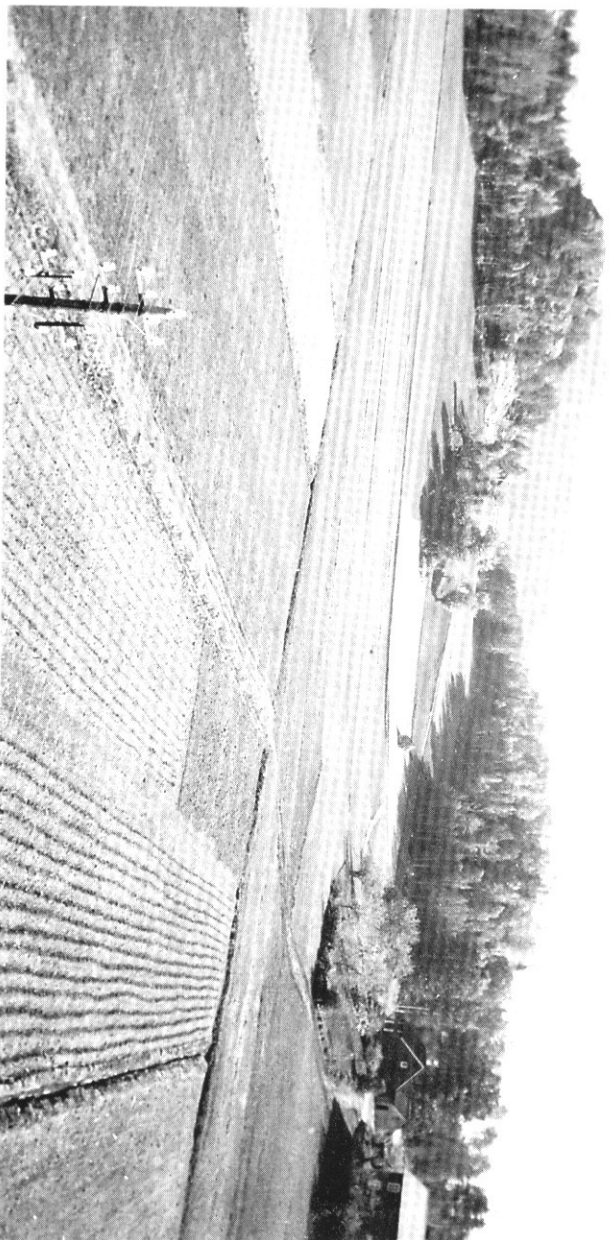
Vormli ca. 1925.

Vormli-gårdene ligger som i et basseng med Vormlimyra midt i. Myra var ikke dyrkbar før en kom på slutten av 1700-tallet og lærte drenering, og var i beste fall et beiteareal. Det var bakkene på sidene en hadde å holde seg til. Tidlig på 1600-tallet ser det ut til at det er bare én oppsitter på gården, men på slutten av 1600-tallet er den delt